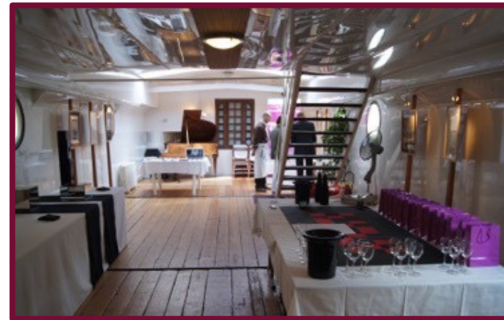
Team Building LANCÔME Challenge œnologique sur une péniche à Paris