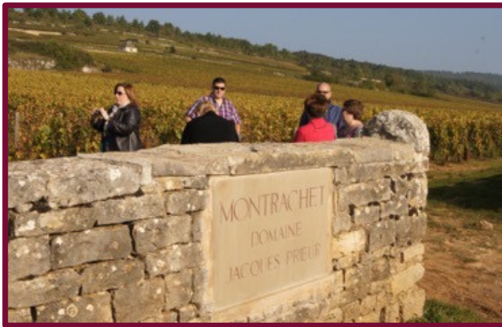
Séminaire en Bourgogne 3 jours de travail et de découverte

Nous prenons en compte l'ensemble de votre organisation (lieu, traiteurs, décoration, mobilier, hôteses, animations, ...)